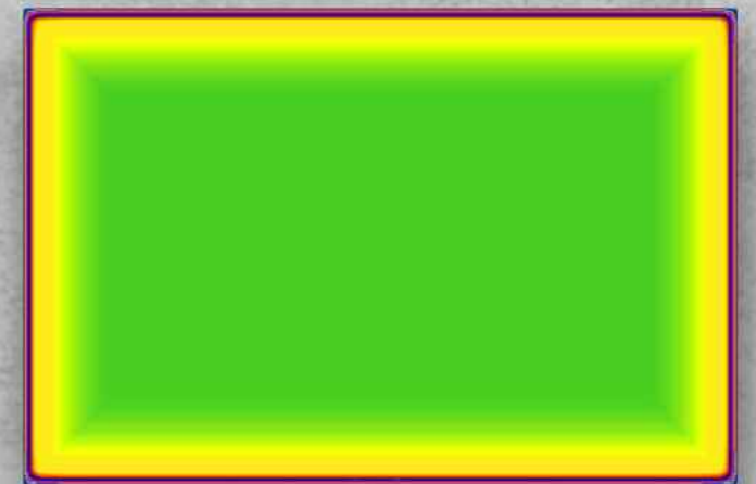
"TROPHIES IN THE SKY" (2001) Datagraphie-Ifochrome Neubau der Sporthalle Ellhofen New building sports hall Ellhofen, Germany Architects: Bechler/Krummlauf, Heilbronn

© 2005 Georg Mühleck / VG Bild-Kunst, Bonn DATA VILLAGE ART Portvasgo, Toronto, Stuttgart, London Photos: Galerie Manfred Rieker, Heilbronn am Neckar georg@mybrain.s.bawue.de • georg@muhleck.info