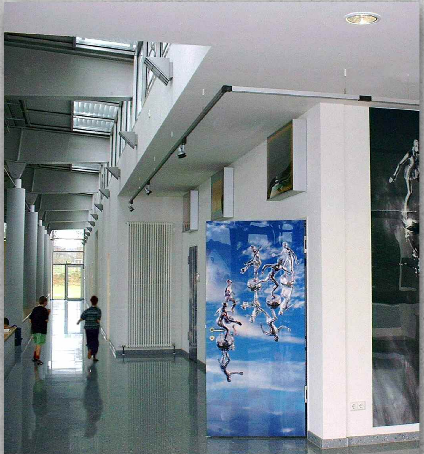
„TROPHIES IN THE SKY I/II/III/IV“ 2001, Datagraphie-Ilfochrome. Türblätter mit Leuchtkästen und Wandbild 300 x 220 cm Datagraph Ilfochromes (2001). Doors with light boxes and mural 300 x 220 cm